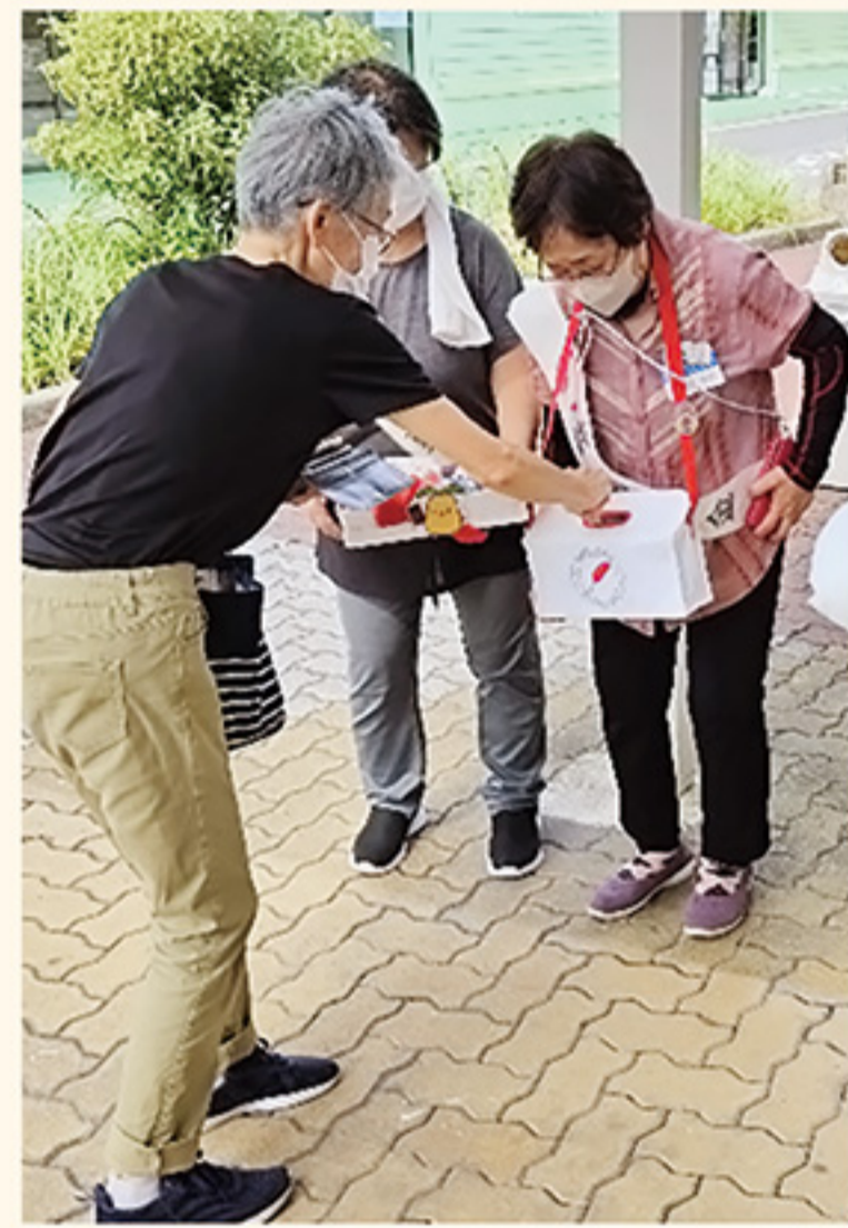
木更津市赤十字奉仕団による街頭募金